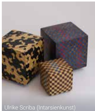
Ulrike Scriba (Intarsienkunst)