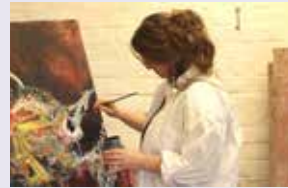
Kerstin Carlsson Am Ende , Kunst & Malerei Kaiserstraße 130