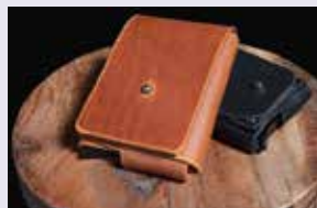
Don Rico Leder Georgstraße 4