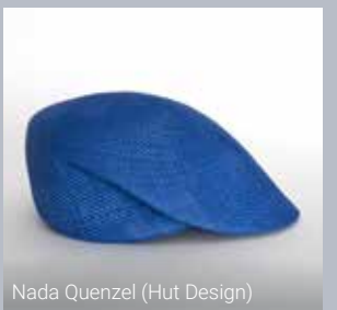
Nada Quenzel (Hut Design)