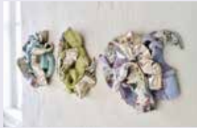
Atelier Ines Rother Keramik & Malerei Bahnhofstraße 15