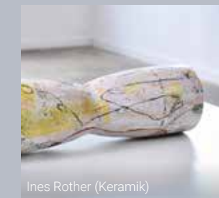
Ines Rother (Keramik)