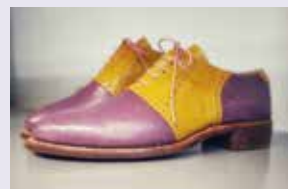
Schumacherei Becker Schuhmacherei Mühlenstraße 39