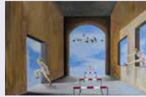
Harry Bergold Kunst & Malerei Bahnhofstraße 15