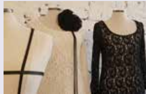
Charly Couture Modedesign Mühlenstraße 24