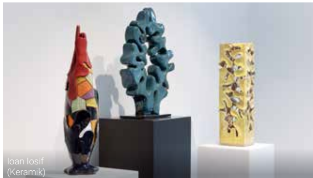
Ioan Iosif (Keramik)