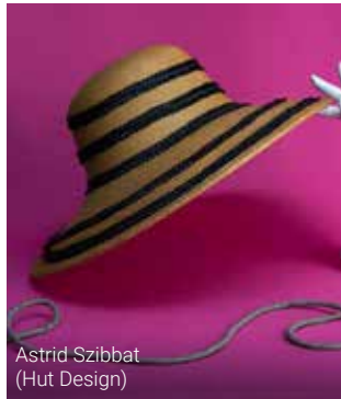
Astrid Szibbat (Hut Design)