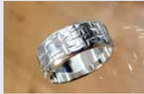
Atelier Maniatis Schmuck & Malerei Mühlenstraße 28