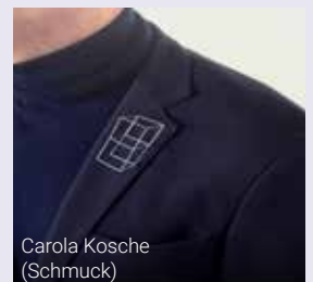
Carola Kosche (Schmuck)