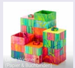
Ulrike Wiesner (Papier & Buchbinden)