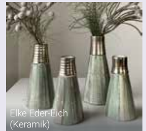
Elke Eder-Eich (Keramik)